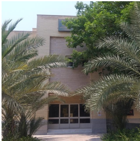
شکل ۲-۲: دانشکده فنی و مهندسی دانشگاه هرمزگان