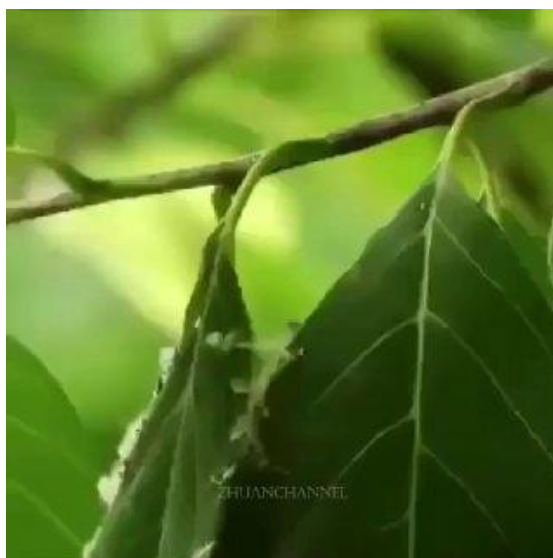
شکل ۲-۳: هندسه مخزن تحت فشار.

جدول ۲-۱: بار کمانش غیرخطی مخازن با جنس‌های مختلف دارای حجم 0.04 \text{ m}^3 و طول r .